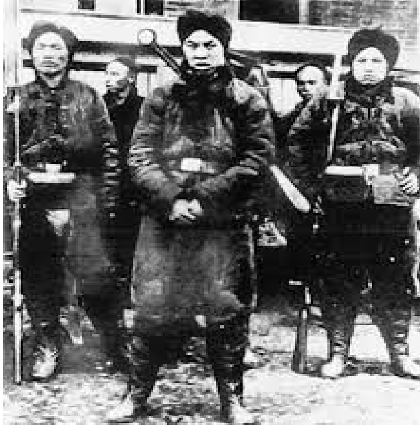
1900 இல் பாக்ஸர் போராளிகள்