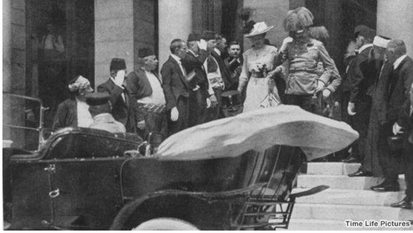
இளவரசர் பிரான்ஸ் பெர்டினாண்ட் படுகொலை, ஜூன் 28, 1914