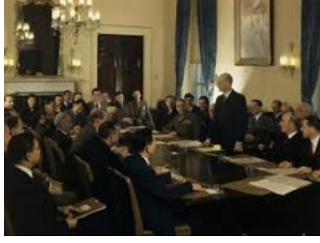
தூரக் கிழக்கு நாடுகளின் குழு