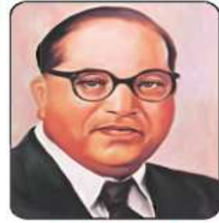
டாக்டர். பி.ஆர். அம்பேத்கர்